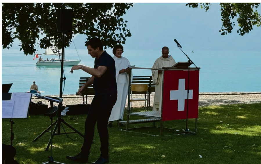
Célébration œcuménique et patriotique au bord du lac.