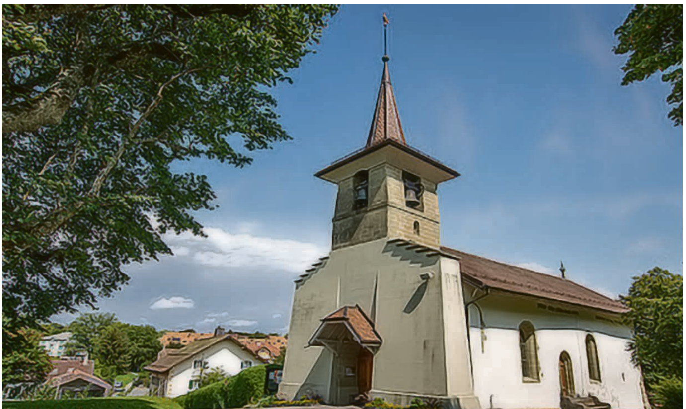
Culte régional à Savigny le 15 septembre.

SAVIGNY-FOREL Dimanche 1 er septembre, 10h, Savigny. Dimanche 8 septembre, 10h , Forel, avec cène. Dimanche 15 septembre, 10h , culte régional, Savigny. Dimanche 22 septembre, 10h , Forel. Dimanche 29 septembre, 10h , Savigny, avec cène. ▲