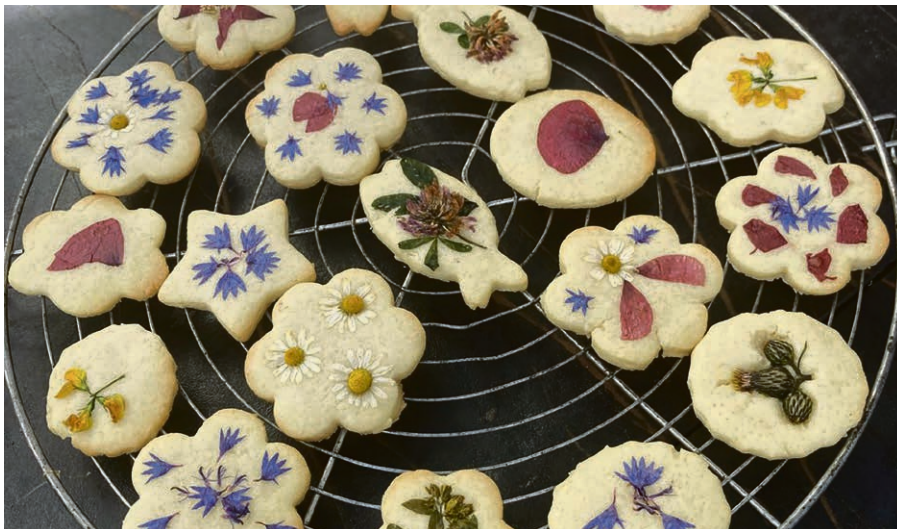
Des mets concoctés à partir de plantes cueillies lors d'une sortie nature.

Ces « Bibles au Jardin » ont été une véritable source d'inspiration et de renouveau spirituel pour notre communauté. Nous espérons que ces rencontres auront semé des graines de réflexion et de paix dans vos cœurs, tout en renforçant les liens entre nous.