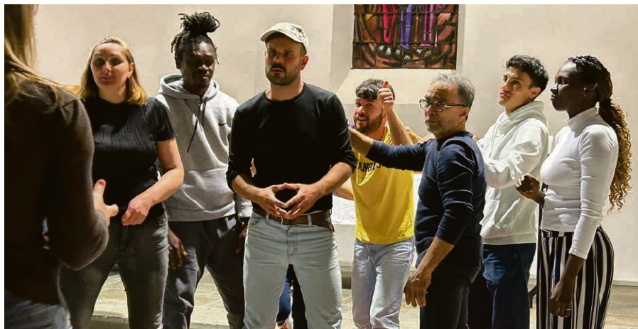
Répétition dans le temple de Cully.

Samedi 5 octobre, à 20h , Crêt-Bérard. Dimanche 6 octobre, à 17h , Crêt-Bérard. Jeudi 10 octobre , Table ronde (sans spectacle), Maison de l'Arzillier, Lausanne. Samedi 12, à 20h, et dimanche 13 octobre, à 17h , Maison Pulliérane, Pully.