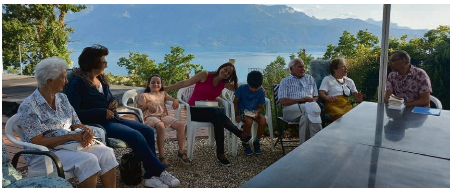
Magnifique moment passé ensemble et avec le souffle de Dieu, présence inspirante à toutes les saisons de notre respiration.