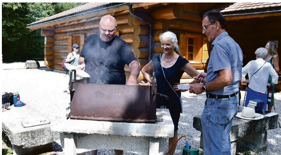
Temps convivial à la paroisse de Grandson.

Merci de vous inscrire auprès d'Elisabeth Bally, 077 428 08 00.