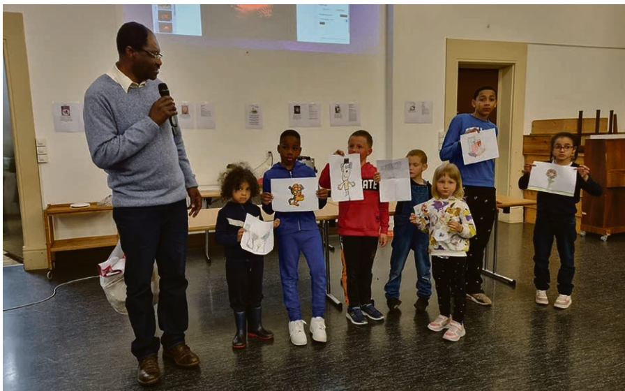
Animation avec les enfants dans le cadre d'Église Ambulante.

La Foire aux Trouvailles des 19 et 20 septembre s'inscrit dans cette perspective. Merci pour votre soutien. Infos : Martine Lindanda, 078 679 68 45.