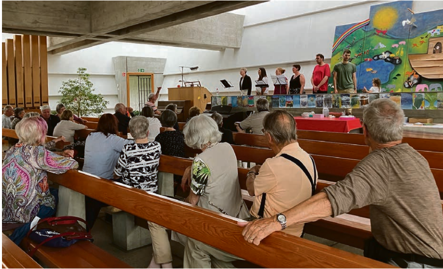
Portes ouvertes à l'occasion du 60 e anniversaire du temple de Fontenay.