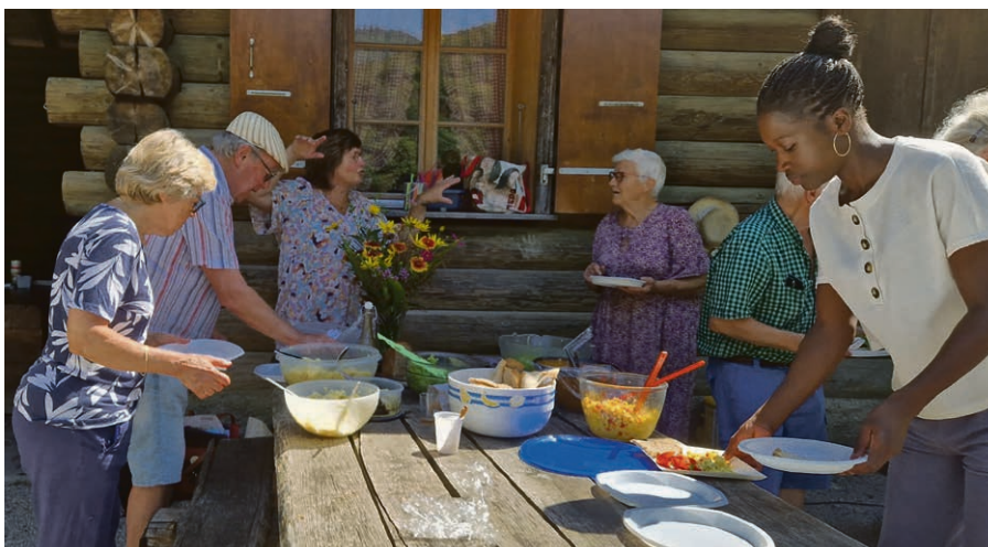
Journée conviviale au refuge des Rochettes – 11.08.2024.