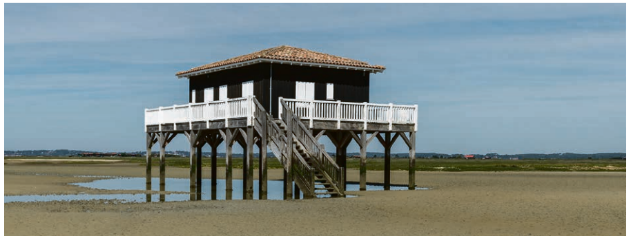
La relation conjugale repose sur quelques « piliers » essentiels, à l'image d'une maison sur pilotis.

En effet, notre perception du couple est biaisée par une vision romantique