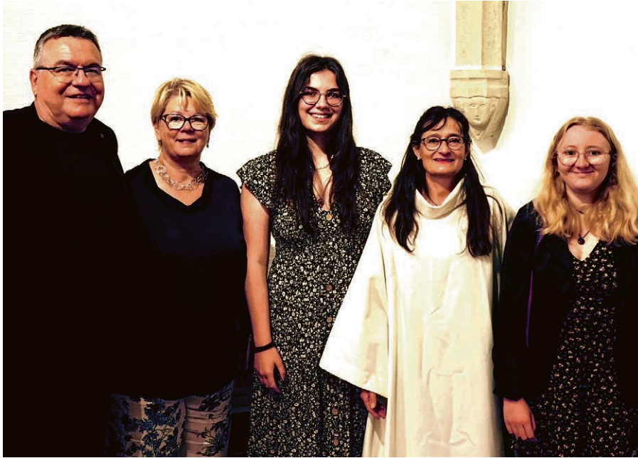
N'hésitez pas à rejoindre le nouveau conseil paroissial!