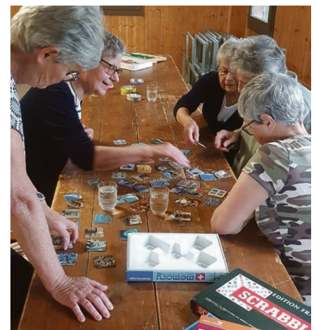
Rencontre des aînés au refuge de Suscévaz – 03.07.2024.