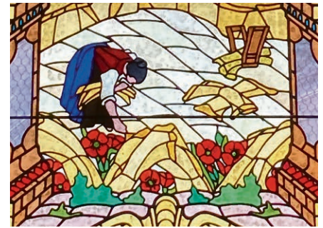
Moissons. Vitrail Donneloye.