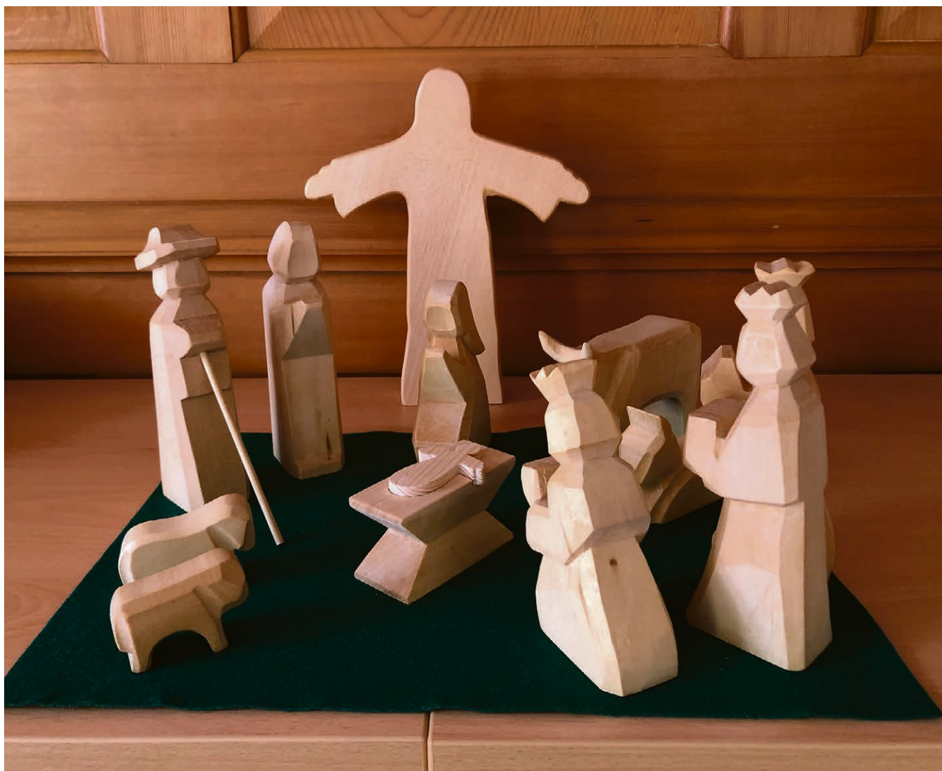
Une approche des récits bibliques adaptée aux plus petits.

Le 24 août 2024 de 9h30 à 17h , venez participer à la journée annuelle d'EcoEglise à Lussy-sur-Morges. Au programme : célébration œcuménique, table ronde, ateliers théoriques et pratiques et rencontres. Plus d'infos sur ecoeglise.ch . ▲