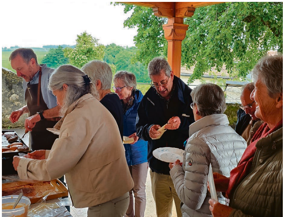
Les estomacs n'ont pas été oubliés lors de la fête de paroisse.