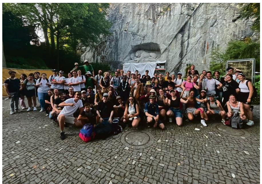
Le lendemain du ZugDay organisé par les jeunes de l'AJRM (ici une photo de l'édition 2023), les paroissiens de SLV et du Pied du Jura vivront aussi leur excursion en train, le dimanche 25 août.

Il est possible de participer à toute ou à une partie de la journée. Renseignements auprès des ministres de la paroisse. ▲