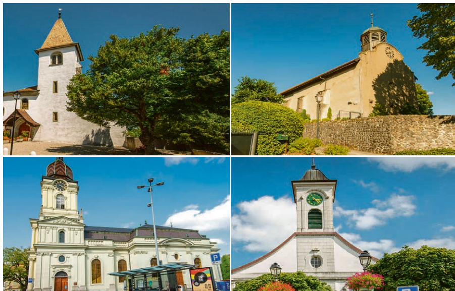
De gauche à droite : Les églises d'Aubonne, de Pampigny, de Morges, de Préverenges.

Abrillant célébrations et temps de prière, elles constituent aussi de jolis buts ou détours de promenade entre nature et patrimoine.