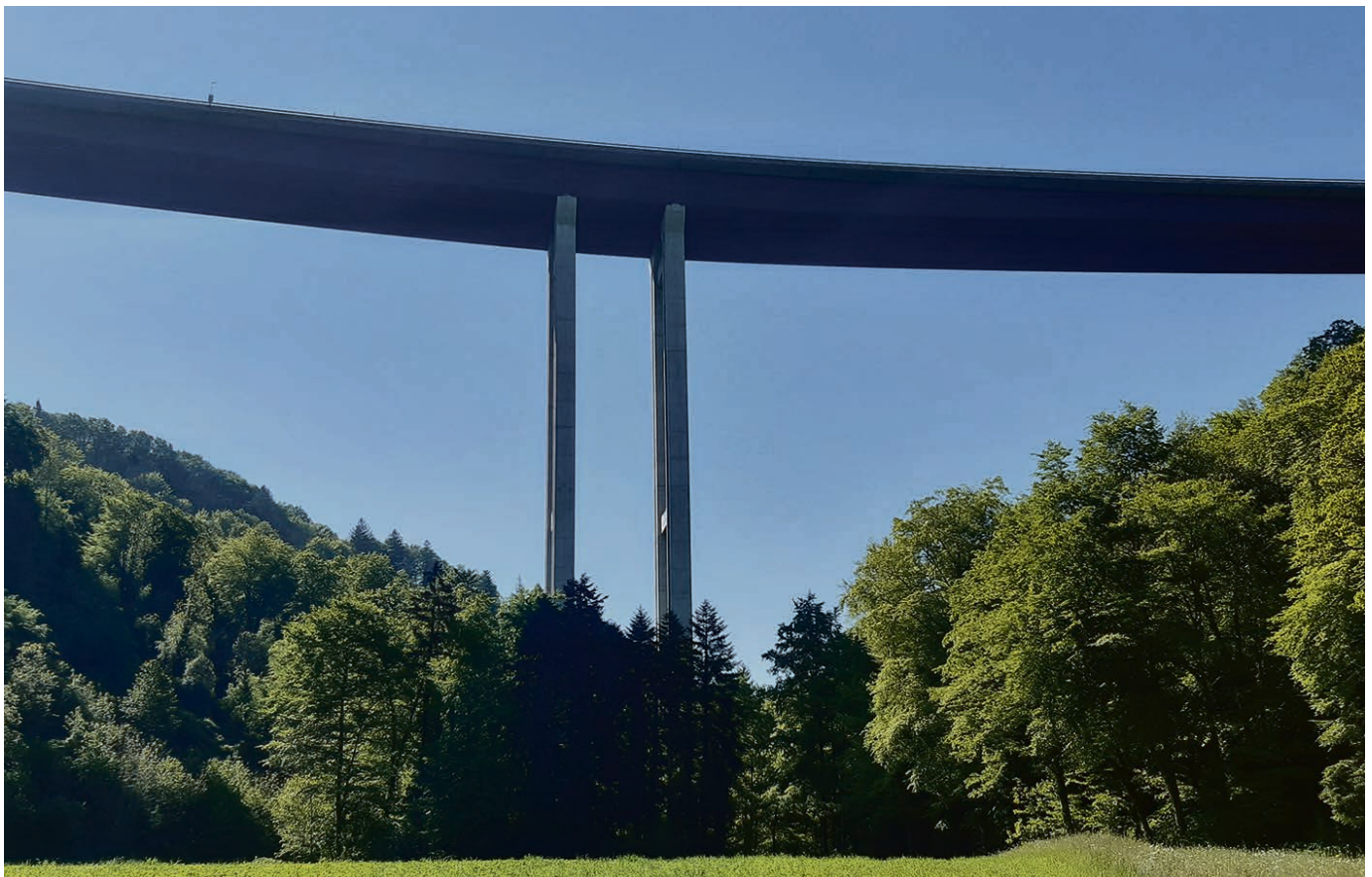
Le viaduc des Vaux - Yverdon.