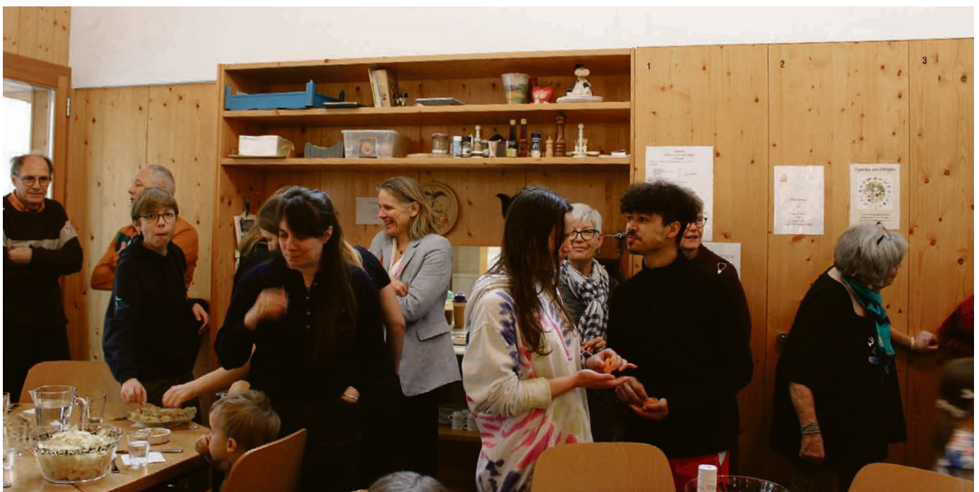
Accueil fort convivial en arrivant à Bex.