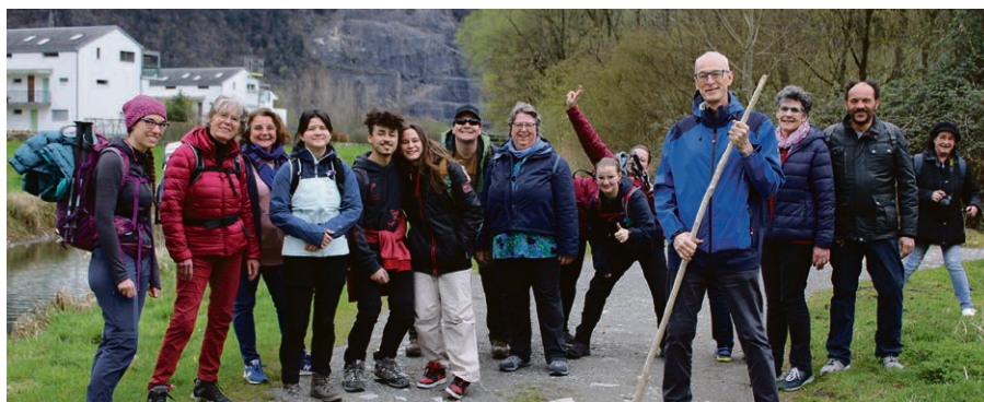
Les JRCV lors de la première étape Villeneuve-Aigle.