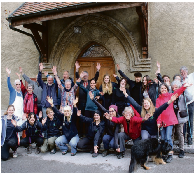
Pose photo devant le temple d'Ollon.