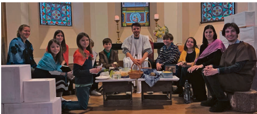
Schauspiel-Schlusszene.