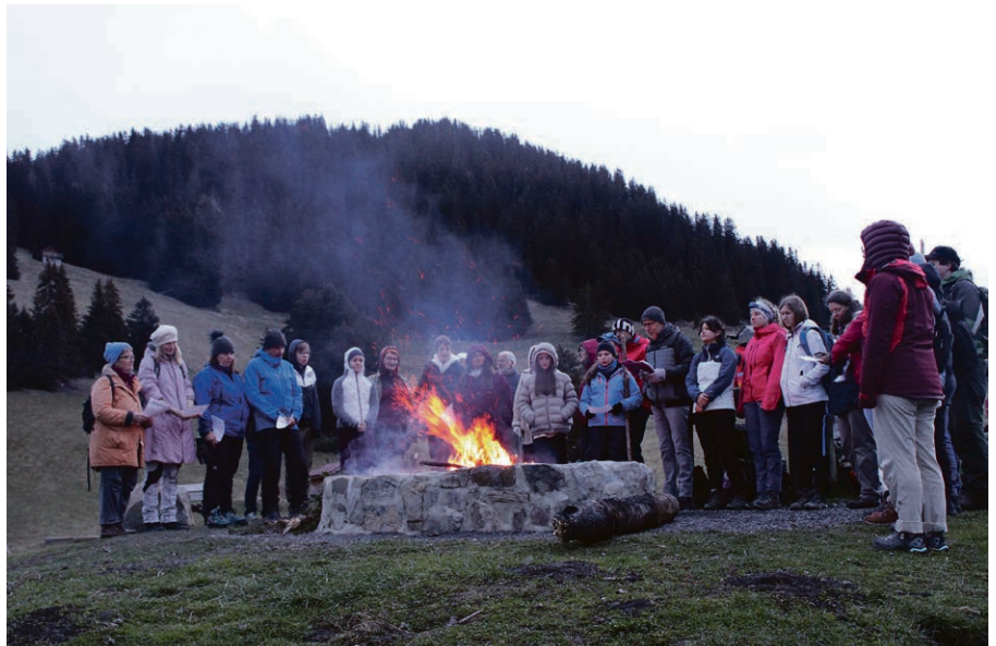
Les JRCV assistent à l'aube de Pâques sur le plateau de Prafandaz.