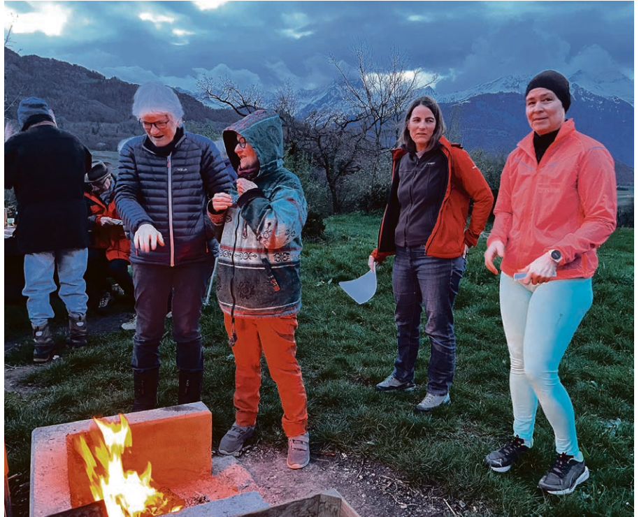
Aube pascale à la tour de Saint-Triphon pour accueillir la Lumière de la résurrection.

OLLON-VILLARS Jeudi 9 mai , rejoignez-nous à Huémoz pour un moment en famille. Culte ludique à 10h au temple suivi d'un repas canadien (possibilité de faire des grillades). Une place de jeu et un château gonflable permettront aux enfants de dépenser leur énergie. Une invitation particulière sera faite aux familles des enfants ayant reçu le baptême lors de l'année écoulée. Nous nous réjouissons de vous retrouver à cette occasion.