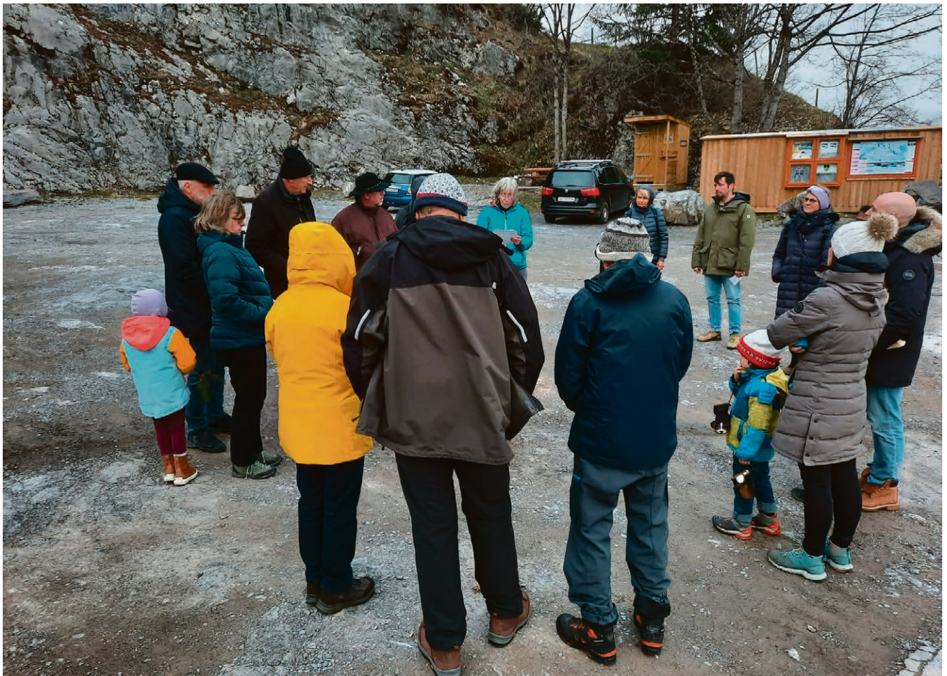
Prière œcuménique à la carrière des Chamois à Leysin Vendredi-Saint.

Une trentaine de paroissiens se rendra dans les Vallées vaudoises du Piémont (Italie) du jeudi 9 au dimanche 12 mai.