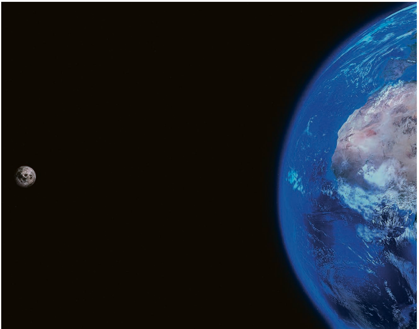
La CEVAA, une communauté d'Eglises à travers le monde.

Jeudi 23 mai, à 18h , Lavey-Village, temple. ▲