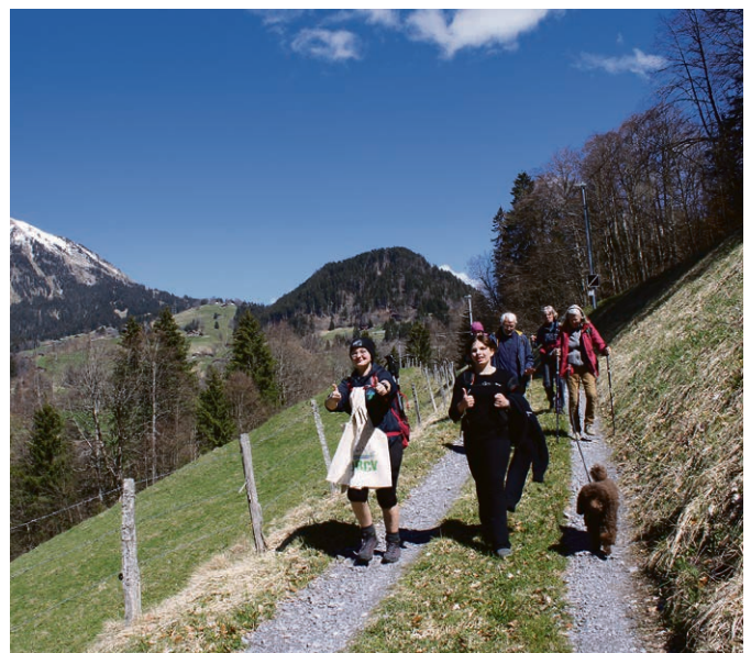
Les marcheuses et les marcheurs ont pu profiter du soleil le dimanche de Pâques.