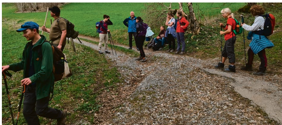
Le groupe sur la montée de Leysin.