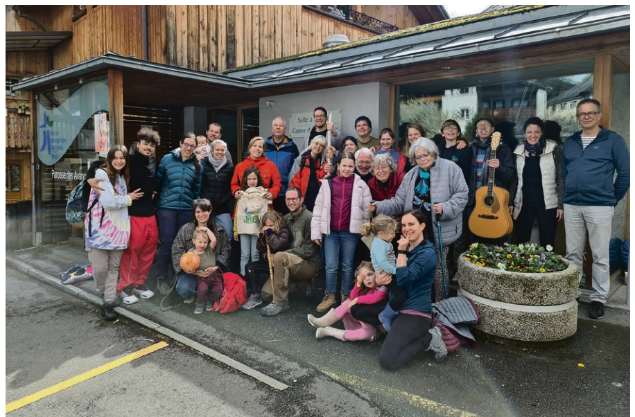
Les JRCV devant la paroisse des Avançons lundi 1 er avril 2024. Regardons comme c'est beau de manger et de chanter ensemble!